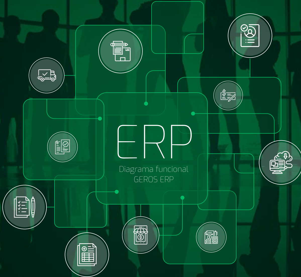
Diagrama funcional GEROS ERP